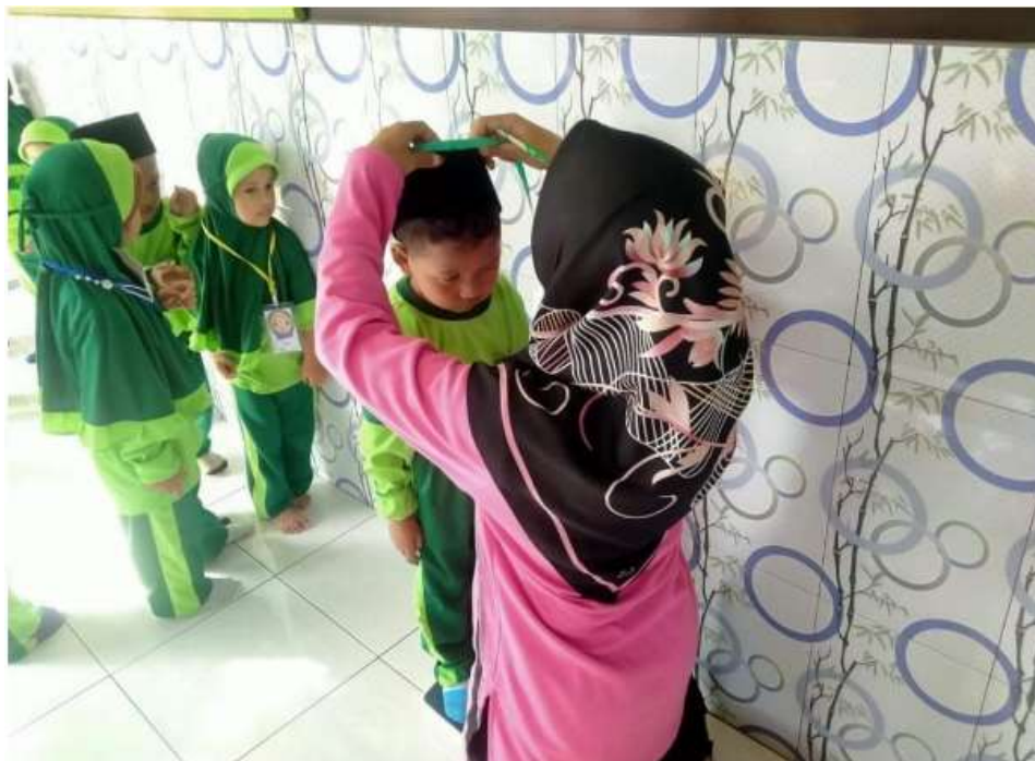
Gambar 3. Pengukuran tinggi badan

Berikut gambar pelaksanaan pengabdian kepada masyarakat :