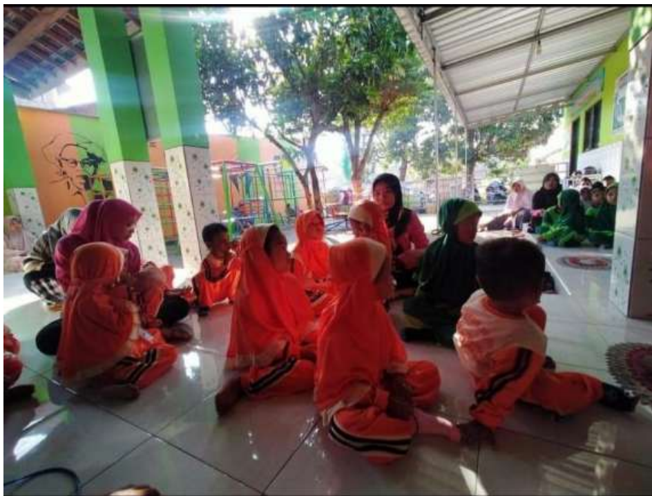
Gambar 5. Kegiatan pengabdian kepada masyarakat