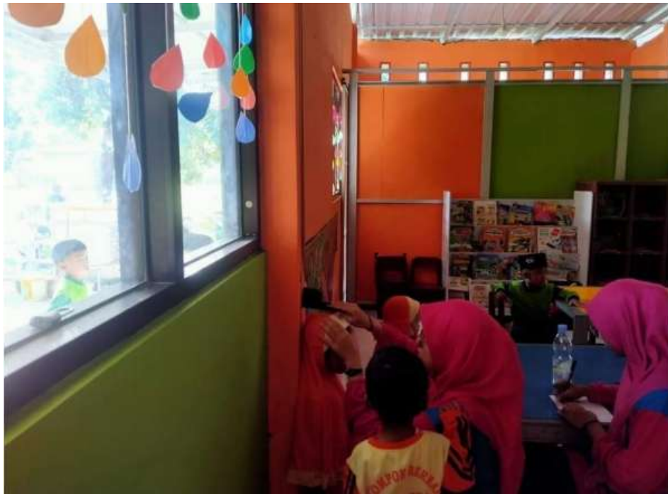
Gambar 4. Pengukuran tinggi badan